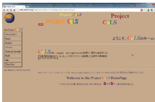
図1 旧URL http://cals2.sozo2.ac.jp

まずは、パターンAである。具体例として、私のサイトのURL変遷を一例として示す。Project CaLSのサイトは、私の前任校の時代ではhttp://cals2.sozo2.ac.jp (図1)で