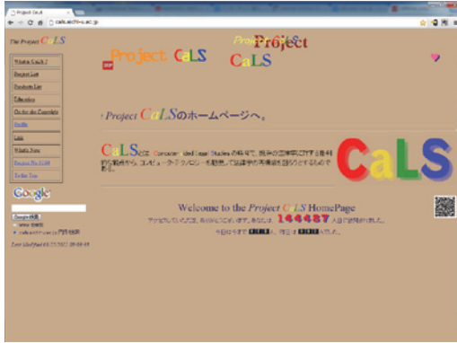
図2 新URL http://cals.aichi-u.ac.jp

あった。2004年に愛知大学に移ったことにより同一のサイト名が、 http://cals.aichi-u.ac.jp (図2) へと変わった。よってURLとして http://cals2.sozo2.ac.jp を典拠としている私の過去の論文は、インターネット上で入手可能なPDFファイル 10 も含め、全てリンク切れになっている。旧URLから新URLへと誘導する場合、旧URL上のサイトに移転先を明示する若しくは旧URLを自動的に新URLへと導くWebページを置けば解決となるが、既に所属していない組織のサーバーにそのようなWebページを置くことは難しい。よってドメイン名の多様化にともなう変化もあわせて、URLが変化することは避けられず、リンク切れは今後も頻発することとなる。